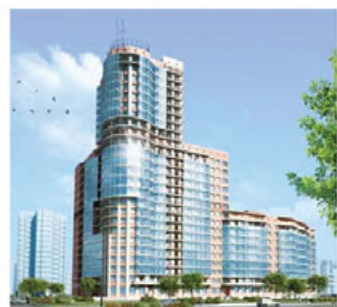
Москва, от 110 000 р/м²