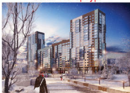
Приморский район, от 1 900 000 р.