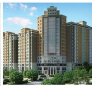
Казань, от 48 000 р/м²

Полная база недвижимости и подробная информация по телефонам