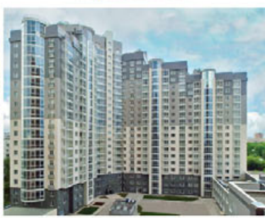
Ярославль, 45 000 р/м²