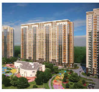
Нижний Новгород, 45 000 р/м²