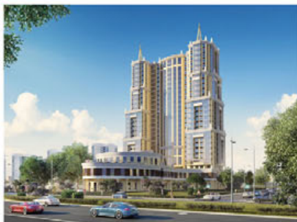
Московский район, от 2 553 000 р.