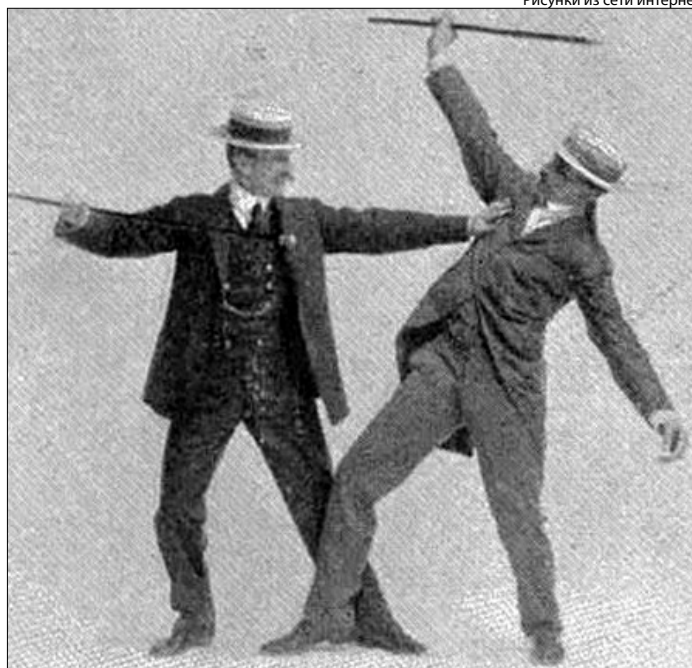
Рисунки из сети интернет

Бартит-су вновь обрела свою популярность благодаря писателю Артуру Конан Доилу. Это