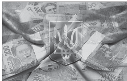
Фотографии из сети интернет