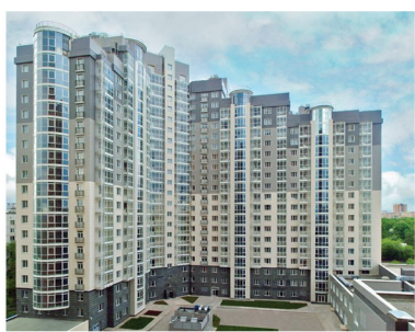
Ярославль, 45 000 р/м 2