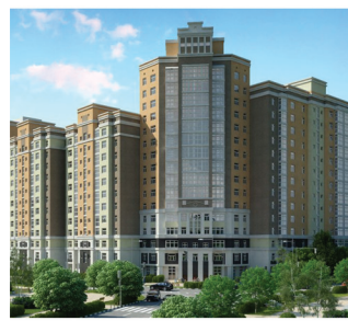
Казань, от 48 000 р/м 2

Полная база недвижимости и подробная информация по телефонам