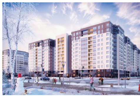
Красносельский район, 1 800 000 р.