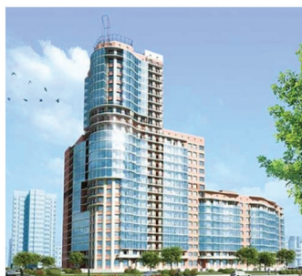
Москва, от 110 000 р/м 2