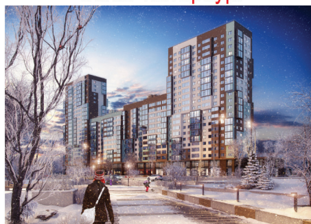
Приморский район, от 1 900 000 р.