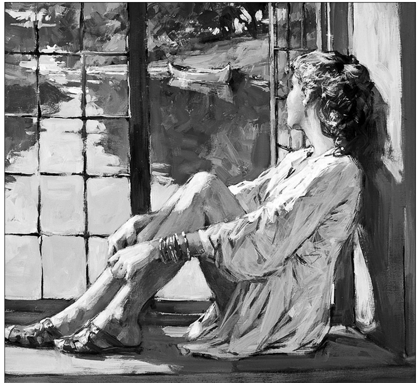
Рисунок из сети интернет