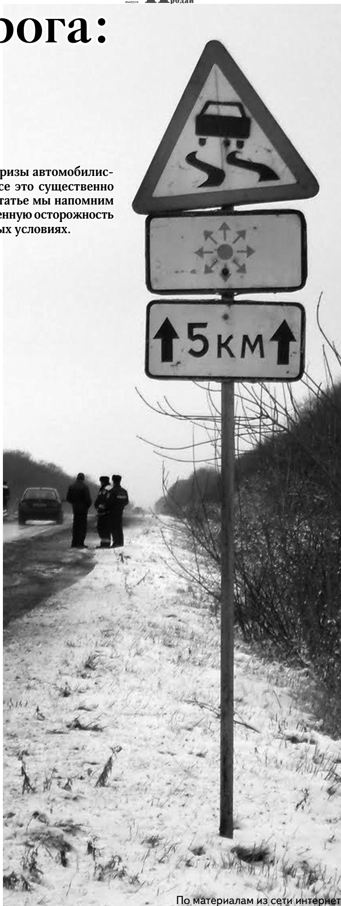
По материалам из сети интернет

Наступившее время года и к пешеходам предъявляет свои требования. Спрятавшись от непогоды, натянув шапки и шарфы, пешеходы должны быть особенно внимательны и предусмотрительны, осторожность должна стать основной чертой поведения на дороге. Рекомендуем в темное время суток всем гражданам обозначать себя световозвращающими элементами. Обращаем внимание родителей на то, чтобы они приобретали одежду для детей уже с нашивкой светоотражающих элементов. Помните, что пешеходы должны двигаться по тротуарам или пешеходным дорожкам, а при их отсутствии – по обочинам. На нерегулируемых пешеходных переходах пешеходы могут выходить на проезжую часть после того, как оценят расстояние до приближающихся транспортных средств, их скорость и убедятся, что переход будет для них безопасен.