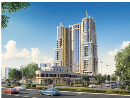
Московский район, от 2 553 000 р.