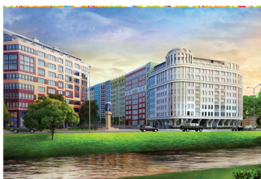
Василеостровский район, от 4 350 000 р.