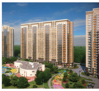
Нижний Новгород, 45 000 р/м 2