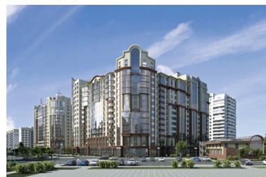
Калининский район, от 2 464 000 р.