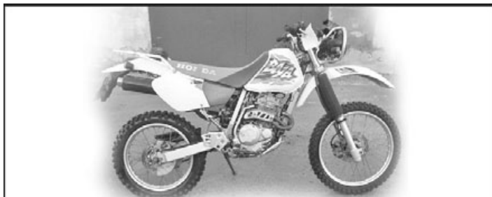
Мотоцикл Honda-Baja-250, 1997 г.в., привезен из Японии в 2012 г., пробег 11400 км, сост. отличное, все расходники новые, 150 т.р. Т. 8-904-236-84-74.

• Штамп. диски, новую головку блока в сборе, на «Волгу». Т.: 74-07-32, 8-912-958-87-46.