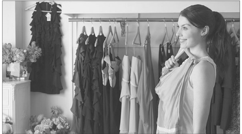
Фотографии из сети интернет

машинное, которое абсолютно не держит форму и теряет вид после первой же стирки. В качестве альтернативы можно выбрать вещь с полупрозрачными элементами, например, рукавами.