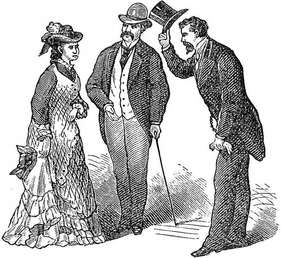
Рисунок из сети интернет www.ok.ru