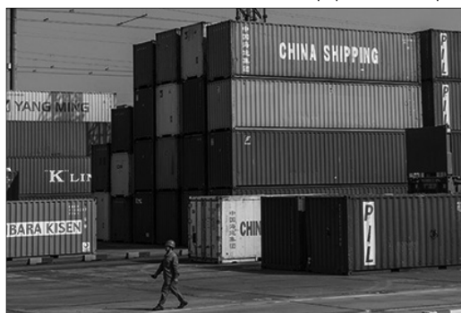
Фотографии из сети интернет