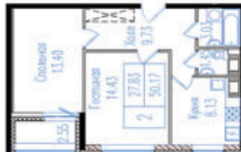
2-комн. 50,4 м 2 - 5 596 000