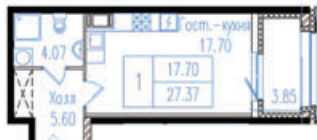
Студия 29,4 м 2 – 3 528 000