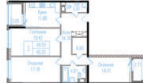
3-комн. 89,2 м 2 - 8 620 000

Мы поможем вам сделать правильный выбор и приобрести квартиру, которая станет предметом вашей гордости!