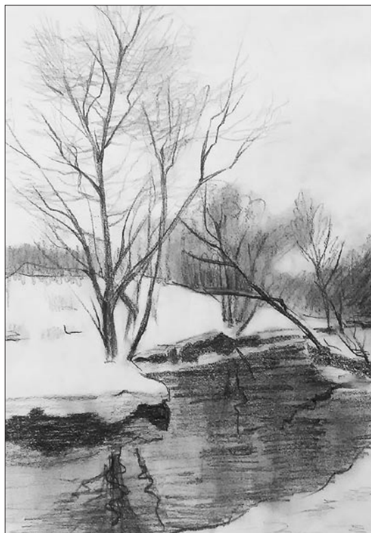
Работы Светланы Девальтовской